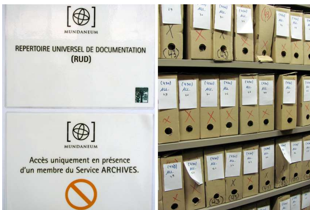
Links: die Tür zum Universelle Dokumentations-Verzeichnis . Rechts: meine 73 Boxen.

Das Mundaneum mit seiner Geschichte ist noch immer eine wunderbare und verrückte Idee für mich. Nur erschließt es sich nicht von alleine. Und ohne professionelle Anleitung und Erschließungsroutine lässt sich hier für einen FaMI leider kaum etwas lernen.