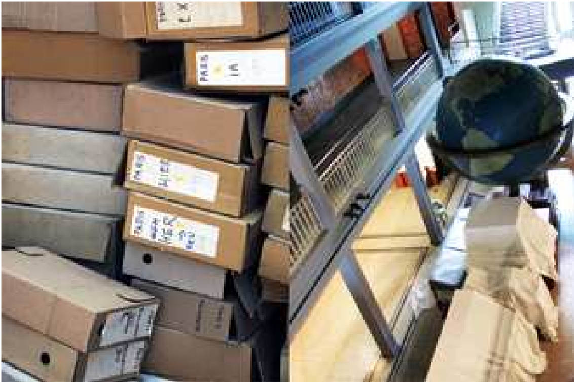
Links: Umpacken des Archivmaterials. Rechts: Innenraum des Museums während der Renovierungsarbeiten.

Das heutige Mundaneum ist Ende des 19. Jahrhunderts aus der Utopie zweier belgischer Männer, namentlich Paul Otlet und Henri La Fontaine, erwachsen, die das gesamte Wissen der Welt sammeln, dokumentieren und mit Hilfe der hierfür erarbeiteten Universellen Dezimalklassifikation (UDK) erschließen und verzeichnen wollten. Handelte es sich anfangs noch um das Sammeln und Verzeichnen von reinem Schrifttum, erweiterte sich das Material schnell um optische Wissensspeicher, wie etwa Fotografien, Postkarten, Poster und optische Glasplatten ( plaques de verres ). Ein universelles Dokumentationszentrum sollte sämtliches Wissen bündeln und anbieten und so den Frieden und die Zusammenarbeit zwischen den Völkern unterstützen. Otlets Gedanke war, dass alle Menschen friedlich miteinander existieren können, wenn der weltweite Zugang zu Wissen egalitär und uneingeschränkt möglich ist. Zu diesem Zwecke plante er gemeinsam mit dem Architekten LeCorbusier die Cité Mondiale , eine architektonisch hochmoderne Weltstadt, die alle intellektuellen, ökonomischen und politischen Institutionen an einem Platz versammelt und infrastrukturell erschließt. Im Zentrum dieser geistigen und moralischen „Hauptstadt der Menschheit“ sollten die fünf großen Traditions-Einrichtungen intellektueller Tätigkeit emporragen: Bibliothek, Museum, wissenschaftliche Einrichtungen, Universität und das Internationale Institut für Bibliographie (IIB).