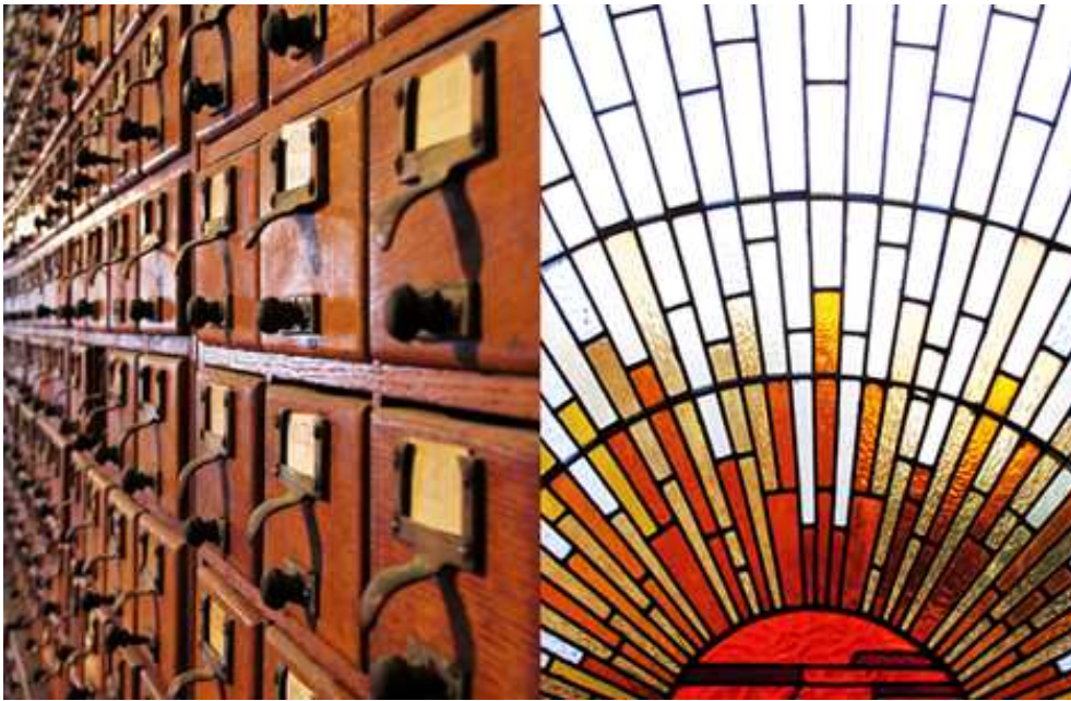
Links: die universelle Bibliographie als Zettelkatalog. Rechts: die UDK versinnbildlicht als Sonne; Fenster im Mundaneum.