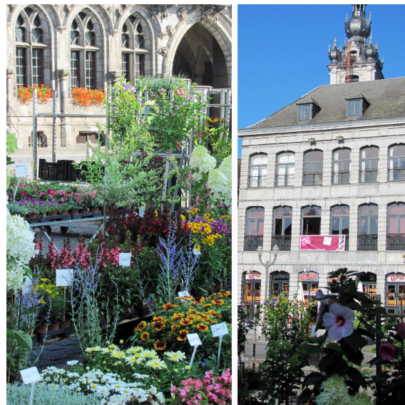
Marktplatz mit Blumenmarkt, Rathaus und Beffroi (Glockenturm) **